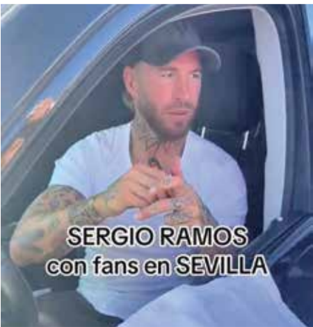
SERGIO RAMOS con fans en SEVILLA

چند روز پیش ویدیویی در شبکه‌های اجتماعی منتشر شده که نشان می‌دهد سرخیو راموس در ماشینش مشغول امضای پیراهن برای هوادارانش است، اما زمانی که پیراهن رئال مادرید به سمتش برده می‌شود حاضر به امضای آن نیست. او پیراهن سویا و حتی پی‌اس‌جی را امضا کرد ولی دوبار به امضای پیراهن رئال پاسخ رد داد. ویدیویی که طبقاً بازتابی منفی در میان هواداران رئال داشت. راموس اسطوره رئال است و ۱۶ سال برای این باشگاه بازی‌هایی به پادماندنی انجام داد و کسی انتظار چنین حرکتی از او نداشت. راموس ولی به این ویدیو واکنش نشان داد و توضیح داد چرا آنجا حاضر به امضای پیراهن رئال نشد: «چون قبل از آن من ۶ پیراهن رئال را امضا زده بودم. همچنین برخی این پیراهن‌های امضا شده را در اینترنت می‌فروشدند.»