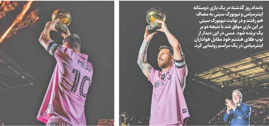
بامداد روز گذشته در یک بازی دوستانه اینترمیامی و نیویورک سیتی به مصاف هم رفتند و در نهایت نیویورک سیتی در این بازی موفق شد با نتیجه دو بر یک برنده شود. مسی در این دیدار از توپ طلای هشتم خود مقابل هواداران اینترمیامی در یک مراسم رونمایی کرد.