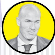
زین الدین زیدان

نویل در شبکه اجتماعی X در مورد گل جنجالی نیوکاسل به آرسنال نوشت: «گابریل به جلو خم شده بود تا خودش را به جلو و پاهایش را به عقب پرتاب کند. این برخورد خطا نیست. به نظر من گل نیوکاسل صحیح بود. خروج توپ از زمین در بهترین حالت قابل تشخیص نبود و قطعاً از نظر من خطایی صورت نگرفته است. اگر هم VAR نمی تواند صحنه را آقساید تشخیص دهد، پس تصمیم داوران داخل بازی باقی می ماند.»