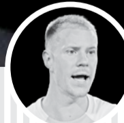
مارک آندره تراشتگن

آنچلوتی سرمربی رنال مادرید برای چند بازی بعدی به فکر بهترین جانشین برای شوامنی هافبک مصدوم تیمش است. طبق ادعای آاس، اصلی‌ترین گزینه جانشینی برای او ادواردو کاماوینگا است. هافبک همه‌کاره رنال مادرید که هر جا نیاز باشد برای رنال به میدان می‌رود. کارلتو اخیراً تأیید کرده بود که بهترین پست برای کاماوینگا، هافبک دفاعی است. گزینه دوم تونی کروس خواهد بود که با این پست بیگانه نیست.