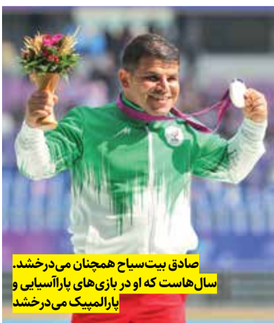
صادق بیت‌سیاح همچنان می‌درخشد. سال‌هاست که او در بازی‌های پارآسیایی و پارالمپیک می‌درخشد.