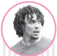
ترنت الکساندر آرنولد

سرمربی اسپانیایی در مصاحبه‌ای در خصوص نقش رونالدو در تیم پرتغال گفت: «من هرگز با بازیکنی متعهدتر از کریستیانو رونالدو کار نکرده‌ام؛ او به طریزی باورنکردنی از بدن خود مراقبت می‌کند. ما کریستیانو را برای مدت‌ها همراه خود خواهیم داشت. من با کریستیانو رونالدو جاه طلبی آشنا شدم که همواره خود را وقف تیم ملی کرده است. وقتی در جام جهانی قطر او را دیدم، از فروتنی‌اش شگفت‌زده شدم.»