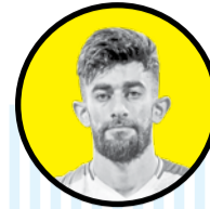
علی قلی زاده

علیرضا جهانبخش از جمله بازیکنانی است که اولین بار توسط کارلوس کی روش به تیم ملی ایران دعوت شد. او ارتباط نزدیکی با کی روش داشت و سه جام ملت ها و سه جام جهانی را همراه او سپری کرد. حالا در فینال تورنمنت اردن، جهانبخش انگیزه بسیاری دارد تا نشان دهد اعتماد کی روش به او بی دلیل نبوده است. جهانبخش در ترکیب اصلی حضور خواهد داشت.