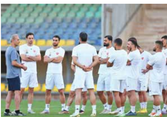
تیم پرسپولیس در زمین ورزشگاه آزادی

مقابل گل‌گهر سیرجان بازی کنند و از حالا دلشوره دارند که نکنند در این بازی باز هم مصدوم بدهند و شرایط تیم قبل از بازی هفته سوم لیگ قهرمانان مقابل استقلال تاجیکستان بهم بریزد. گفتنی است پرسپولیس بعد از بازی مقابل گل‌گهر، سه شنبه ۳ آبان باید در تهران از تیم استقلال تاجیکستان میزبانی کند که اگر تا آن زمان حداقل به صورت جزئی وضعیت زمین چمن ورزشگاه آزادی ترمیم نشود خبری از فوتبال خوب نخواهد بود و البته احتمال مصدومیت بازیکنان هر دو تیم را تهدید می‌کند.