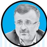
محمد رضا داورزنی:

معاون توسعه ورزش حرفه ای وزارت ورزش و جوانان گفت: «مدال های کسب شده از سوی بانوان ملی پوش کاروان در آغاز بازی های آسیایی هانگژو بی نظیر بود. این موفقیت ها نشان داد که در جمهوری اسلامی ایران به رغم سیاه نمایی هایی که از سوی دشمنان می شود، ورزش بانوان دارای جایگاه بالایی در ایران است.»