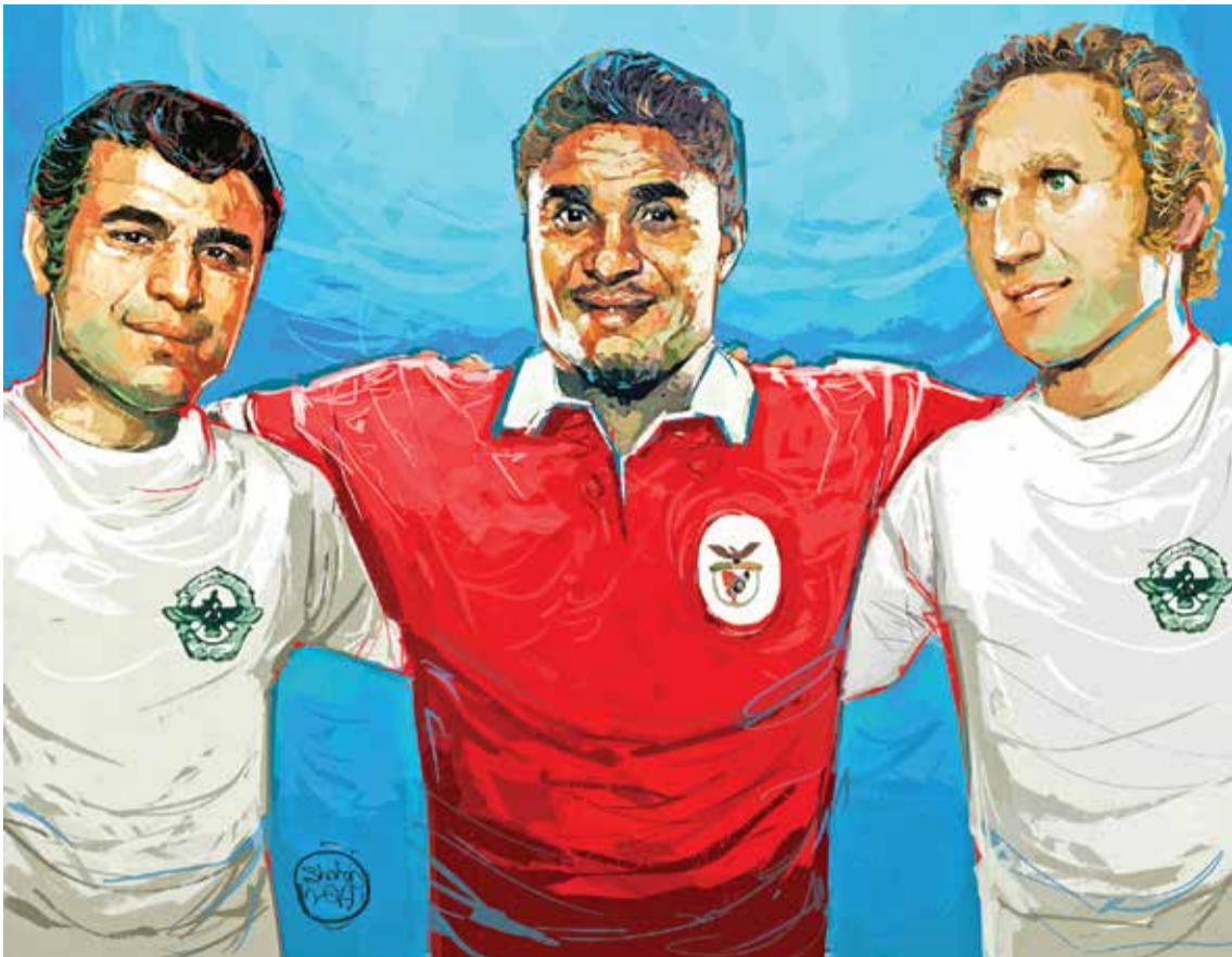
طرح: شهاب جعفریانزاد