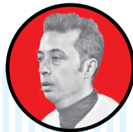
موعود بنیادی فر

بلافاصله بعد از مسابقات تیم ملی زنان در مقدماتی المپیک، خاتون بزم نیز به عنوان تنها نماینده ایران در مسابقات جام باشگاه‌های آسیا حضور خواهد داشت. حضور ۹ ملی‌پوش از خاتون در تیم ملی سبب شده است که برگزاری اردوی خاتون و تیم ملی با چالش‌هایی روبه‌رو شود. مشخص نیست خاتون و تیم ملی برای برگزاری اردو چگونه باید دیگر تعامل خواهند کرد. در روزهای اخیر اخباری مبنی بر برگزاری اردوی مشترک خاتون و تیم ملی به گوش می‌رسید.