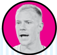
مارک آندره تراشتگن

با اعلام باشگاه منچستر سیتی، جرمی دوکو با عقد قراردادی پنج ساله تا تابستان ۲۰۲۸ به این تیم انگلیسی پیوست. منچستر سیتی بابت جذب این وینگر مستعد مبلغ ۶۰ میلیون یورو با احتساب پاداش به باشگاه رن فرانسه پرداخت می کند. جرمی دوکو طی ۹۲ بازی رن فرانسه، ۱۲ گل و ۱۰ پاس گل را از خود به جای گذاشت. او همچنین در تمامی رده های ملی برای بلژیک به میدان رفته است.