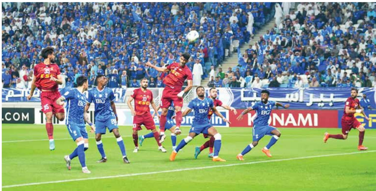
تقابل فوفانا و الاهلی آخرین تجربه حضور تک تیم ایرانی در لیگ قهرمانان آسیا بود.