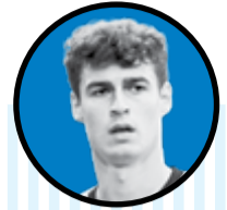
کیا آریسا بالاکا