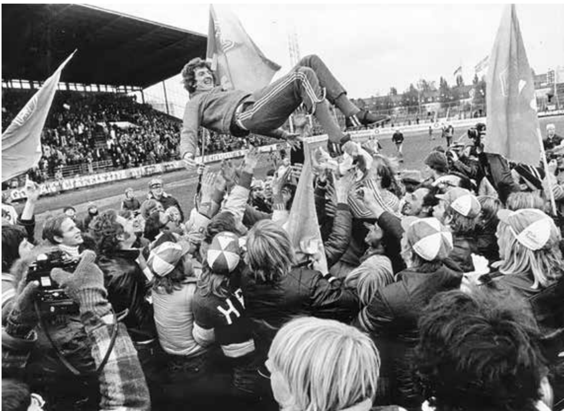
روزی هاجسون اولین قهرمانی خود را در درده باشگاهی را در سال ۱۹۷۶ در سوئد جشن می‌گیرد