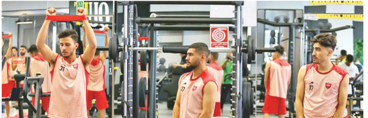
محمد قراکوزلو روزنامه نگار

چرا قهرمان فوتبال ایران از تغییر قوانین متضرر شد؟ جواب ساده است، چون حضور بازیکنان جوان در لیست تنها یک «شو» اجباری است. انگار تغییر قوانین سازمان لیگ بیشتر از هر تیمی به ضرر پرسپولیس تمام شده و شاید بخش عمده ای از اینکه حالا تیم قهرمان فوتبال ایران در فصل گذشته حالات تیم آخر نقل و انتقالات شناخته می شود به سبب همین تغییر قوانین باشد. با احتساب این ماجرا و در نظر گرفتن محدودیت های ایجاد شده چهار بازیکن از فهرست تیم بزرگسال تیم نسبت به فصل قبل کاسته شده و جفت و جور کردن این لیست با در نظر گرفتن کاستی ها کار فوق العاده دشواری به نظر می رسد. پرسپولیس تا الان ۷ خروجی و ۳ ورودی داشته و بالانس نشدن این فهرست با در نظر گرفتن اینکه تیم باید در تمام پست ها دو بازیکن شاخص و کارآمد داشته باشد، نگاه ها را به سمت تغییر قوانین سازمان لیگ معطوف می کند. با وجود این شاید پرسپولیس و گل محمدی بیشتر از تغییر قوانین سازمان لیگ، باید از خودشان ناراحت