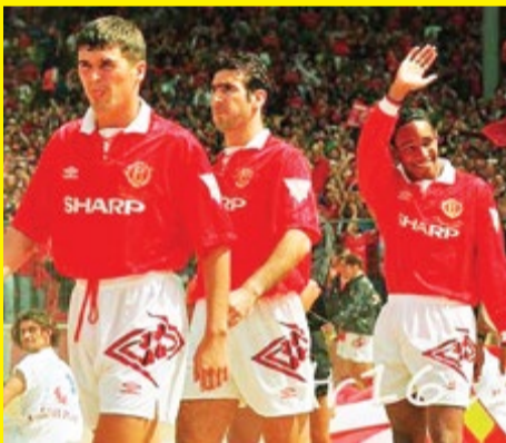
عکسی خاطره انگیز از دهه نود. از زمانی که منچستر یونایتد سرالکس فرگوسن در فوتبال انگلیس حکمرانی می کرد. در عکس تصویر سه اسطوره را می بینید؛ روی کین، اریک کانتونا و پیل اینسی محافظت کرده