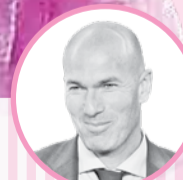
زین الدین زیدان

ستاره فرانسوی در آخرین مصاحبه خود در مورد رسیدن به توپ طلا صحبت کرد. زمانی که از او پرسیده شد که آیا به کسب توپ طلا فکر می کند؟ گفت: «در حال حاضر بله، به توپ طلا فکر می کنم. حتی اگر من به آن فکر نکنم، مردم به من فکر می کنند چرا که نام من همیشه یکی از نام هایی است که مطرح می شود. من کارم را انجام داده ام و این مردم هستند که رأی می دهند. این باعث خوشحالی من است که مردم من را شایسته این عنوان می دانند.»