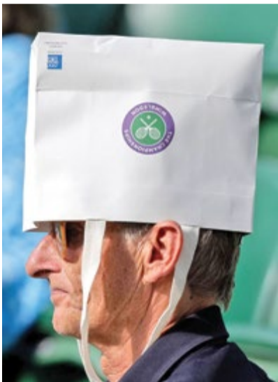
هفته پیش گرم ترین هفته کره زمین در ۱۰۰ هزار سال اخیر بود. این چیزی است که دست کم دانشمندان می گویند. اوضاع برای تماشاگران تنیس ویمبلدون هم البته راحت نیست، در تصویر یک پیرمرد انگلیسی را می بینید که به این شکل از خود محافظت کرده است.