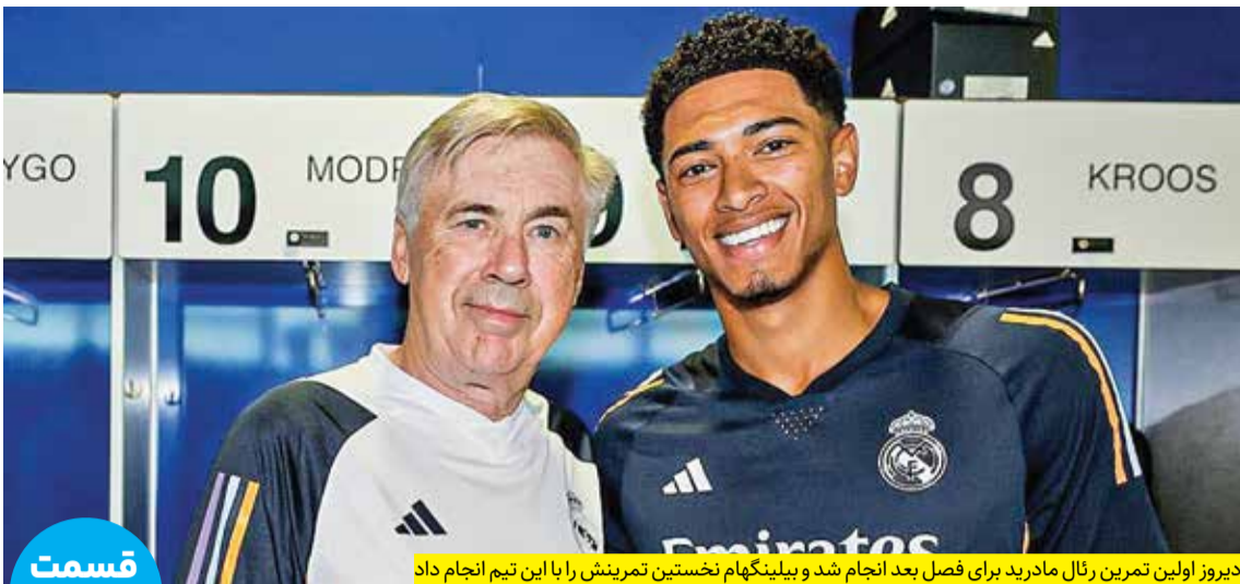
دیروز اولین تمرین رئال مادرید برای فصل بعد انجام شد و بیلینگهام نخستین تمرینش را با این تیم انجام داد