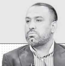
سیاوش اکبرپور مهاجم اسبق استقلال