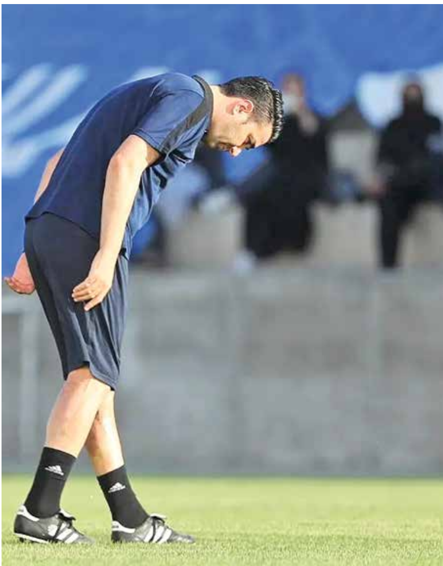
هشدار نگونام به مدیران استقلال درباره بیرانوند