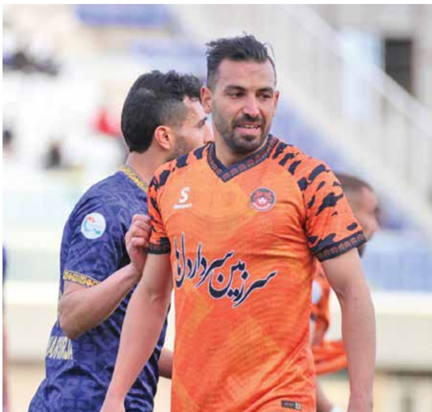
آشنا بود اما در خانه کلاً ۱۲ امتیاز گرفت که کمترین امتیاز داخل خانه است.