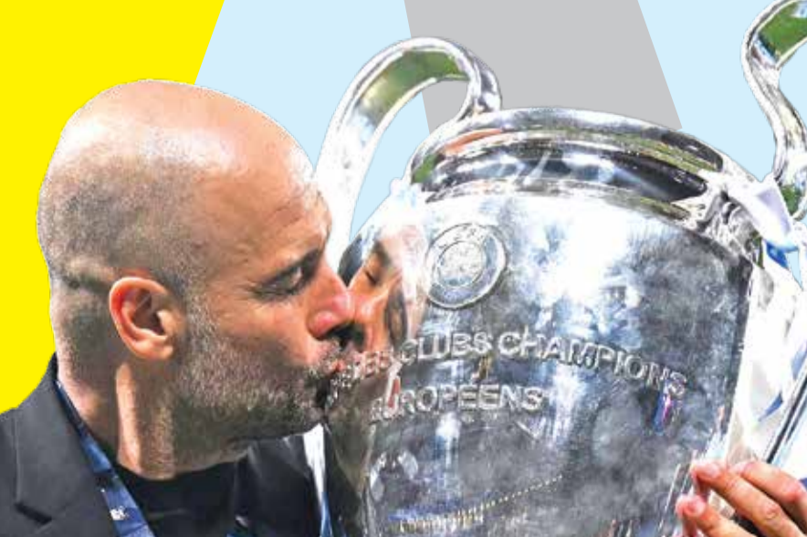
پپ گواردیولا بعد از بازی از خوشحالی در پوست خود نمی‌گنجید، او بالاخره بار دیگر موفق شد و به ۱۲ سال ناکامی خود در این رقابت‌ها پایان داده بود. گواردیولا بعد از بازی در کنفرانس مطبوعاتی گفت: «رئال مادرید مراقب باش، اجازه نمی‌دهیم اعتماد به نفس بالایی داشته باشی، ما فقط ۱۳ جام با شما فاصله داریم و به دنبال هستیم. در بهترین سطح خود نبودیم. پس از جام جهانی، تیم پیشرفت چشمگیری داشت اما صادقانه این بهترین عملکرد ما نبود. اگر ادرسون آن توپ را سیو نمی‌کرد چی؟ حالا که سیو کرد و چیزی نمی‌توانید بگویید! ما نمی‌خواهیم لیگ قهرمانان را ببریم و بعد ناپدید شویم. ما ۸،۷ سال است که عملکرد خوبی داریم اما نمی‌توانیم این جام را ببریم و در نهایت به آن رسیدیم. این مسابقات مانند یک سکه است... می‌توانستیم مساوی کنیم و به وقت اضافه برویم، می‌توانستیم شکست بخوریم، همچنین فودن می‌توانست بازی را ۲-۰ کند تا راحت‌تر برنده شویم. امروز دیگر نوبت ما بود و قبل از اینکه فاجعه‌ای رخ دهد موفق شدیم به چیزی که می‌خواهیم برسیم. حالا نیاز به استراحت داریم، بازیکنان ما اکنون باید برای بازی‌های ملی آماده شوند، بهتر است یوفا و فیفا در این مورد کمی بیشتر فکر کنند، بازی‌ها واقعاً زیاد است، حالا می‌خواهیم با خانواده و دوستان در هتل جشن بگیریم، دوشنبه برنامه رزه در منچستر را داریم، این سه گانه بسیار سخت بود.»

بدون شک بهترین تیم باشگاهی اروپا. برد شنبه شب نه تنها سنگینی طلسم لیگ قهرمانان را از روی دوش منچستر سیتی برداشت بلکه آنها را تبدیل به دومین تیم انگلیسی تاریخ کرد که موفق به کسب سه گانه قهرمانی «لیگ قهرمانان، لیگ برتر و جام حذفی» می‌شوند. این کار پیش از این توسط منچستر یونایتد انجام شده بود. اما سیتی چگونه توانست همه جام‌های مهم را با در هم کوبیدن حریفان خود در این فصل به دست بیاورد؟