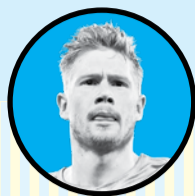
کوین دی بروین:

گوندوغان پس از بازی با اینتر میلان گفت: «واضح بود که هر دو تیم دیدار سختی در فینال لیگ قهرمانان خواهند داشت. ما در نیمه اول در بهترین سطح خود قرار نداشتیم و با وجود اینکه چند موفقیت خوب ایجاد کردیم، کمی مرد بودیم. بازی تقریباً ۵۰-۵۰ بود و مانند بسیاری از فینال ها، امروز تنها همان یک گل تفاوت را رقم زد و خوشحالیم که آن گل را ما به ثمر رساندیم.»