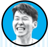
هیونگ مین سون

هیچ کس فکرش را هم نمی‌کرد که فینالیست لیگ قهرمانان فصل گذشته با شروع فصل جدید و خرید داروین نونیز گرانقیمت فصل را به بدترین شکل ممکن آغاز کند. عملکرد نامیدکننده شاگردان کلوپ و همچنین قرعه سخت در مرحله یک هشتم نهایی یوسی ال این شایعات را به وجود آورده است که کلوپ با باز شدن پنجره نقل و انتقالات زمستان وارد مارکت شود و برای پوشش نقاط ضعف تیمش بازیکن جدید به خدمت بگیرد.