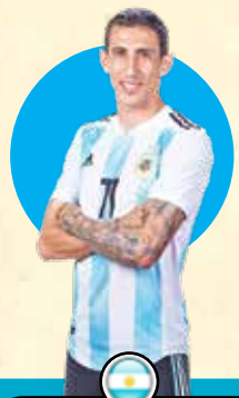
آنجل دی ماریا

دیبالا هافبک هجومی تیم ملی آرژانتین است که در باشگاه رم عضویت دارد. او که از سال ۲۰۱۵ در تیم ملی عضویت دارد، در طول ۳۴ مسابقه تنها ۳ گل برای کشورش به ثمر رسانده. البته مشهوریت دیبالا بیشتر به خاطر پاس گل های او است. به همین خاطر حضور او در قطر برای تیم فنی آلبی سلسته اهمیت دارد.