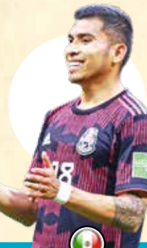
اورلین پینه دا

او شناخته شده ترین چهره تیم مکزیک در سال های اخیر است. خیمنز سابقه بازی در اتلنتیکو مادرید را دارد و هم اکنون در تیم ولورهمپتون اندرز بازی می کند. این مهاجم جزو آن تیم رؤیایی زیر ۲۳ سال مکزیک بود که در المپیک لندن قهرمان شد و در قطر یکی از امیدهای آلتری برای گشودن دروازه هاست.