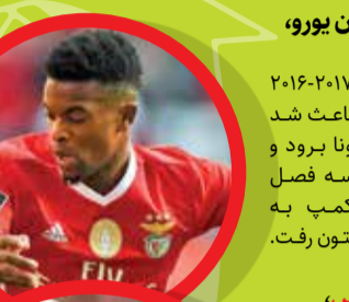
سمو، ۳۵/۷ میلیون یورو، بارسلونا، ۲۰۱۷

محصول آکادمی بنفیکا رشد خارق العاده ای در پرتغال داشت. وقتی اتلتیکو مادرید در تابستان سه سال قبل او را خرید، دومین جوان گرانت قیمت جهان شد. او گران ترین خرید اتلتیکو شد و در واقع چهارمین بازیکن گران جهان بعد از نیمار، کیلیان امباپه و فیلیپ کوتینیو شد. فصل اول کارش در بنفیکا یعنی ۲۰۱۸-۲۰۱۹ باعث شد قیمتش خیلی بالا برود. او در ۱۹ سالگی ۲۰ گل زد و سیمونه که به دنبال جانشینی برای آنتوان گریزمان می گشت، فلیکس را انتخاب کرد.