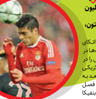
خیمنس، ۳۸ میلیون یورو، ولورهمپتون، ۲۰۱۹

فصل درخشان ۲۰۱۷-۲۰۱۶ با عقاب ها باعث شد به بارسلونا برود و بعد از سه فصل در نو کمپ به ولورهمپتون رفت.