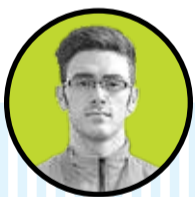
علی اصغر آسیابری:

رکوردشکنی‌ها در اردوی وزنه‌برداری از چند جهت برای ما مهم و ارزشمند است. اولاً این رکوردشکنی‌ها در اوزان المپیک کلیدی می‌خورد. ثانیاً رکوردشکنان ما اغلب ستاره‌های جوان و برنده‌های آینده‌دار وزنه‌برداری ایران هستند، ثالثاً این اتفاق قطعاً انگیزه‌ای مضاعف می‌شود برای چهره‌های شاخص و مدال‌دار جهانی و المپیک‌ما مثل مرادی، رستمی، هاشمی، داودی و... که تقریباً تا پیش از این در عرصه داخلی برای خود رقیب و حریف جدی نمی‌دیدند.