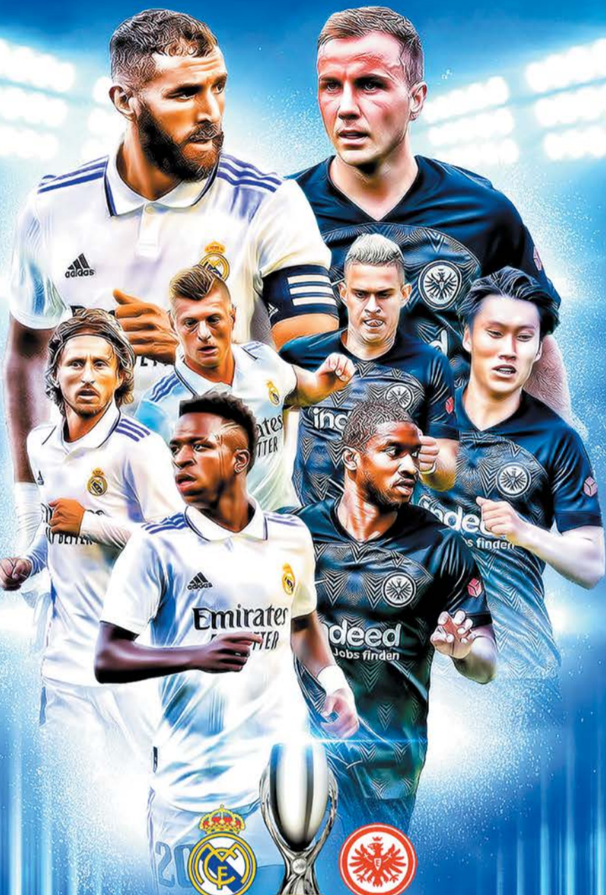
REAL MADRID VS EINTRACHT FRANKFURT

رئال مادرید در حالی پا به این میدان می گذارد که مصدوم خاصی ندارد، هرچند که رنیر ژسوس به دلیل این که احتمالاً بار دیگر قرض داده خواهد شد، در تمرینات غایب بوده است. آنچلوتی باید تصمیم بگیرد که آیا به آنتونیو رودریگو و اولین جوانی برای اولین بار در یک دیدار رسمی بازی خواهد داد یا نه. اما این دو نفر کار سختی برای حضور در ترکیب ثابت در این فصل پیش رو دارند. رودریگو مانند فصل گذشته روی نیمکت قرار می گیرد و در