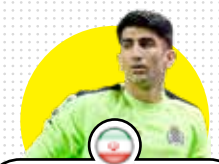
علیرضا بیرانوند Alireza Beyranvand

مربیان دروازه‌بانی که در ایران کار می‌کنند، چندان سطح بالایی ندارند و گرانتی هم نیستند. این در حالی است که فوتبال ایران نیاز دارد تا در همه بخش‌ها مدرن شود. اگر تمرینات با ترقی همراه باشد، درمی‌آید و شاهد افزایش تعداد مدعیان حضور در تیم ملی خواهیم بود اما امروز، فقط یک تعداد خاص و انگشت‌شمار هستند که شایستگی دعوت به کمپ تیم ملی را دارند. این معضلی است که هر چه زودتر باید حل و فصل شود.