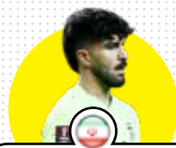
امیر عابدزاده Amir Abedzadeh