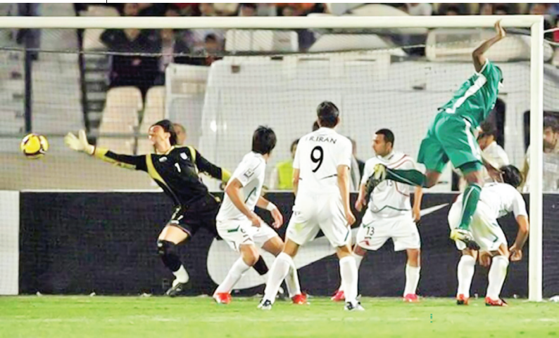
● شادی عربستانی‌ها بعد از پیروزی بر ایران تا مدت‌ها ذهن فوتبالدوستان ایرانی را آزار می‌داد

و دور رفت با پیروزی بر کره شمالی و سه تساوی به پایان رسید.