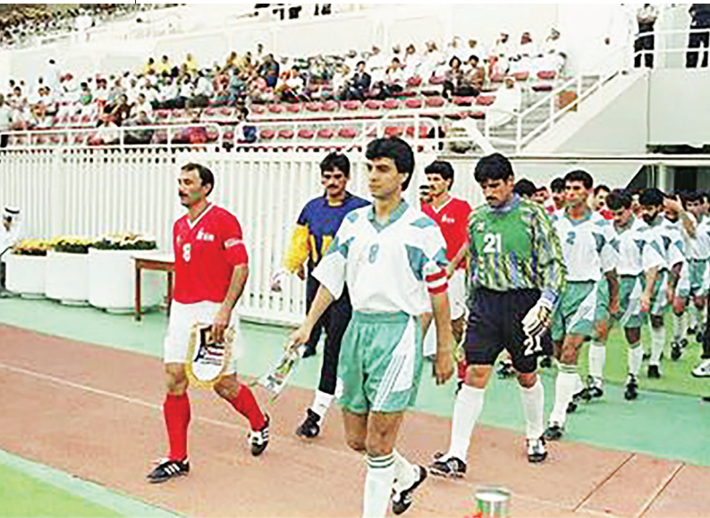
● تیم طلایی با یک دنیا حاشیه در مرحله دوم مقدماتی ۱۹۹۴ ناکام ماند